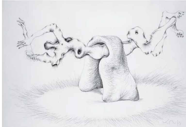
Suspension, encre de Chine, 1973